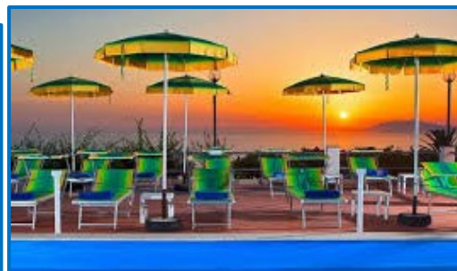
Il girasole, Anacapri